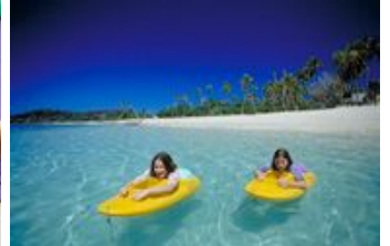
フィジーの離島イメージ