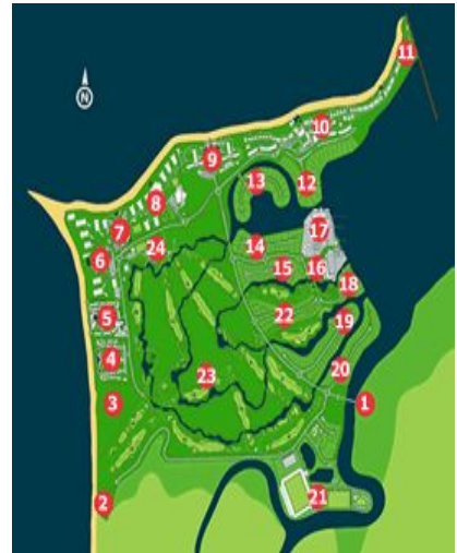
デナラウリゾートマップ

デナラウリゾートを代表するホテルで2008年にリニューアルオープンしてデナラウでは一番新しいホテルです。ゴルフやマリンスポーツなど多彩なアクティビティが用意されています。また、キッズクラブも備えているので女性同士でもファミリーでも、ハネムーンの方にもお勧めのホテルです。