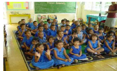
フィジーの小学生