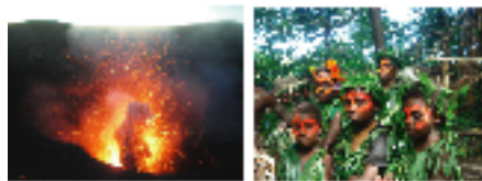
タンナ島・ヤスール火山/イメージ タンナ島ブラックマジックツアー/イメージ

○ヤスール火山ツアー○ タンナ島の草原地帯ホワイトグラスや山間部を4WDでドライブ。その後、大地の鼓動を感じる“ヤスール火山”へ。厚手の長袖やウインドブレーカーご持参の上、スニーカーなどの歩きやすい靴でご参加下さい。 ○ブラックマジックツアー○ カスタムビレッジツアー。ブラックマジックとは、 ①恋を束ねるマジック ②木の棒に精霊が宿るマジック ③天気を司る者の呪文 ④割礼の際に行われるマジック。