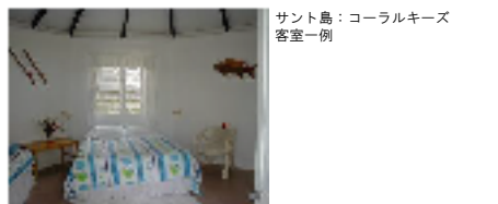
タンナ島:エバーグリーン 客室一例