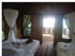
タンナ島:エバーグリーン 客室一例