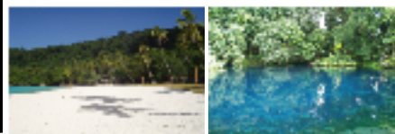
サント島・シャンバンビーチ/イメージ サント島・ブルーホール/イメージ

株式会社アクアラグーン Aqua Lagoon 東京都知事登録旅行業第3-5444号 東京都中央区入船3-9-2佐久間ビル3階 TEL:03-3206-7814 FAX:03-3555-8750 総合旅行業務取扱管理者:横山 裕司 E-mail:info@aqualagoon.co.jp URL:www.aqualagoon.co.jp